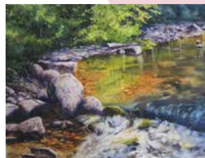
« La Ouatchouan » 22" x 30", Aquarelle

Nous vous attendons pour vivre la trente-et-unième édition du Symposium provincial des Villages en couleurs en compagnie d'une quarantaine d'artistes qui peignent sous vos yeux au Mont-Édouard et à l'aréna Roberto-Lavoie, des nombreux bénévoles, des partenaires et du comité organisateur.