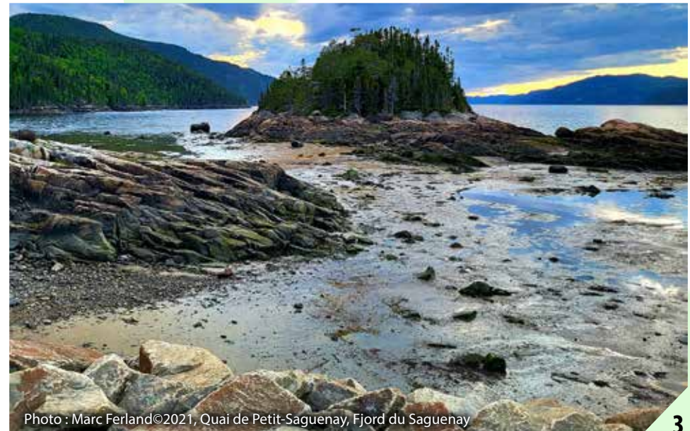
Quai de Petit-Saguenay, Fjord du Saguenay