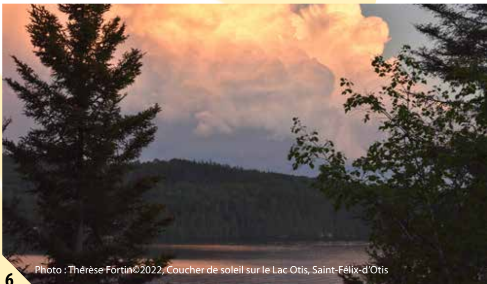
Photo : Thérèse Fortin©2022, Coucher de soleil sur le Lac Otis, Saint-Félix-d'Otis