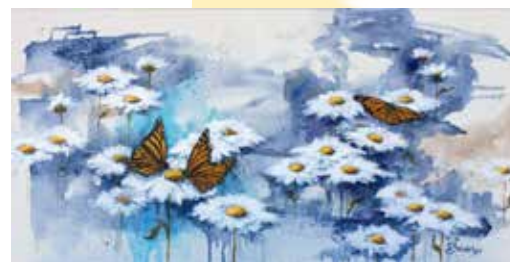
« L'envol de la beauté »

Un merci tout particulier au comité organisateur, aux bénévoles ainsi qu'aux commanditaires. Œuvrant ensemble, multipliant leur savoir-faire avec une grande générosité, afin de faire de cet événement un moment privilégié pour les artistes et ceux qui viennent à leur rencontre.