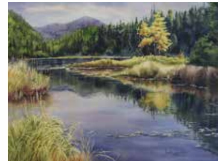
« Petit paradis » 22" x 30", Aquarelle

passion en toute liberté, dans ces grands espaces qui dévoilent leurs couleurs automnales et offrent des paysages magiques et féériques aux artistes et aux amateurs d'art dans ces fabuleux Villages de L'Anse-Saint-Jean et Petit-Saguenay.